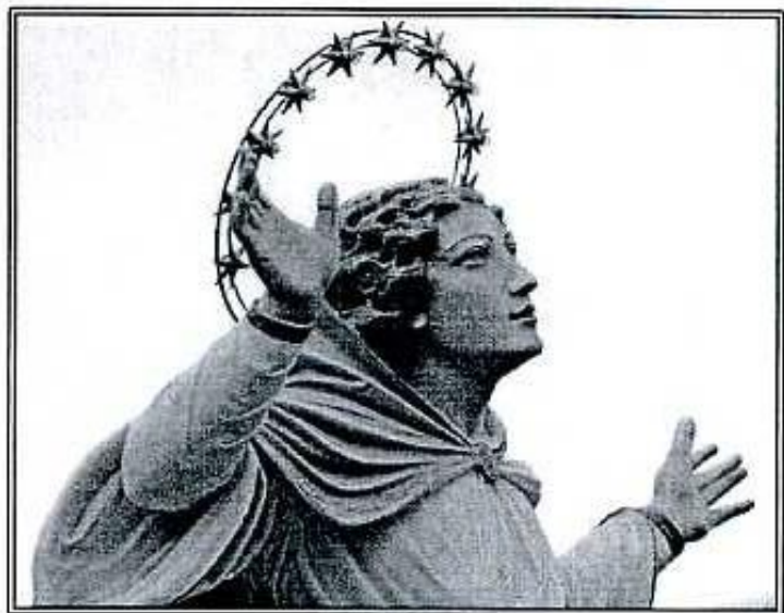
LA NOSTRA MADONNA

ASCOLTA, amico credente, quelle voci e mettiti nel successivo silenzio dinanzi alla "piccola grotta" che dovrebbe essere ogni famiglia di questa diletta Comunità, che, nell'anno che volge al termine, ha significato il Suo affetto alla Chiesa con: